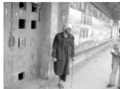
赤十字の病院を訪問