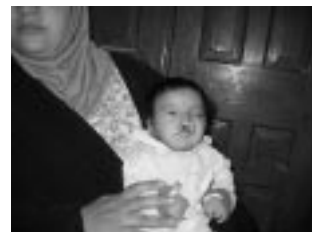
ウサギ口の赤ちゃん